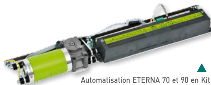
Automatisation ETERNA 70 et 90 en Kit

Monobloc moteur et centrale FAST SET assemblés sur un châssis unique pour réduire le temps de montage à quelques secondes.